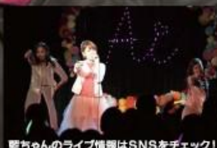
藍ちゃんのライブ情報はSNSをチェック!